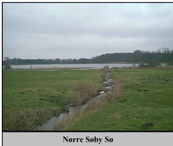
Nørre Søby Sø

sammensætning tilbage i tiden. Kort fortalt viser undersøgelsen, at søen var "ren" frem til omkring 1950, hvorefter forureningen med næringsstoffer (kvælstof og fosfor)