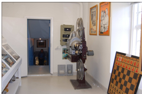
Interiør fra museet: Det gamle forevisningsapparat fra Nørre Søby Bio.