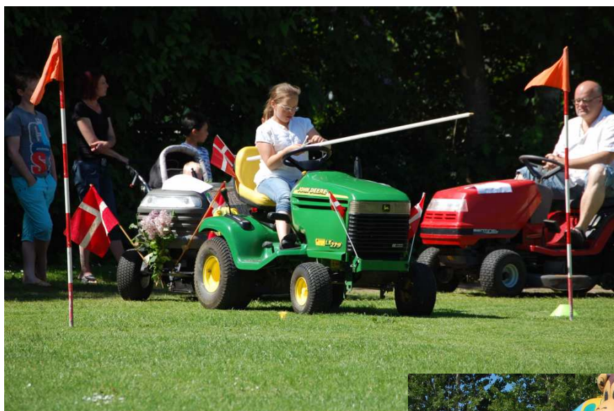
Vejret var strålende og humøret højt ved sidste års byfest.

var første gang i 10 år, hvor overskuddet ikke var stort nok til at dele