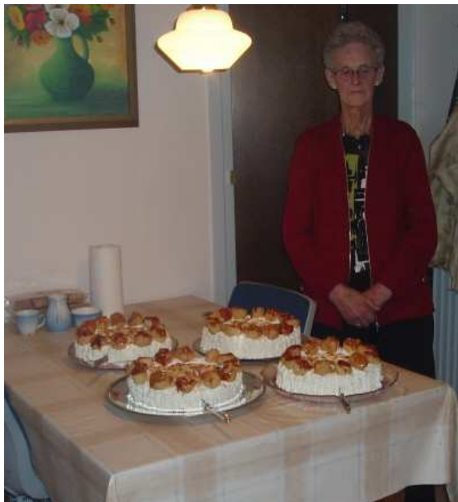
Gerda serverede sine fire lækre Rubinsteinkager.

Selv om de fleste nok både har læst og hørt, at Varmestuen vil få tildelt 100.000 kr. af Den Lokale Aktionsgruppe i Faaborg - Midtfyn (LAG), synes vi, at det fortjener endnu en omtale. Pengene skal bruges til et nyt tag.