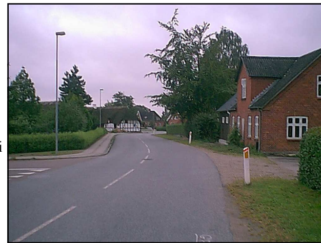
Mit hjem var ”Den gamle Central” (Odensevej 12)

Fra vinduerne i stuen kunne jeg følge med i, når