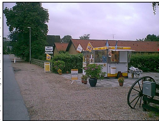
Nørre Søbys Pølsevogn.

Jeg føler det naturligt samtidig med første artikel at give en kort beskrivelse af Odensevej år 2002, for her er virkelig sket meget