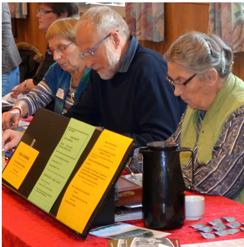
Lokalrådet og Lokalarkivet ved julemessen i Nr. Søby Forsamlingshus

af stabelen i Forsamlingshuset. Det begyndte i 1986, hvor det hed "Julemarked". Et godt initiativ der tog sigte på at skaffe nye stole til Huset. År efter år er samtlige stande "solgt"; her findes alt, hvad et "julehjerte" begærer. Bestyrelsen arbejder hvert år energisk på at skaffe gevinster til det store lotteri; det er en glæde i løbet af dagen at høre, hvor mange, der bakker op om Forsamlingshuset på denne måde – her kan vi virkelig "risikere" at komme hjem