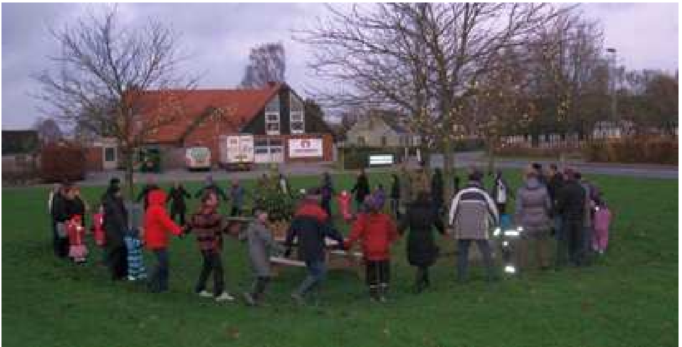
Lysene tændes på Trekanten

mangler isolering. Vi vil gerne have smeden til at installere et nyt fyr og isolere gamle rør – det vil blive et samlet beløb på 275.000 kr.; derfor har vi også søgt Fionia Fonden, som deler ud i februar måned. Vi håber