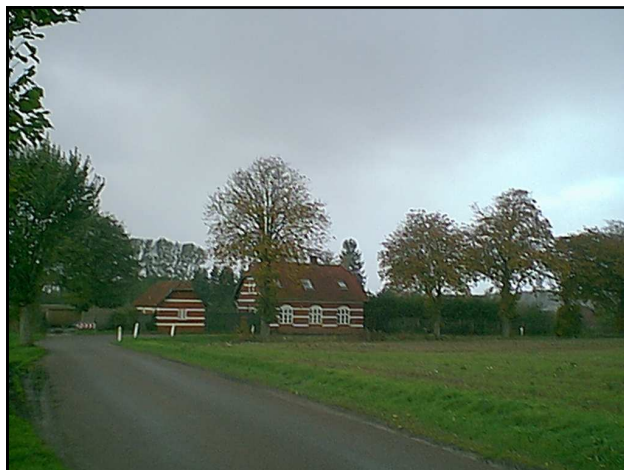
Den gamle station