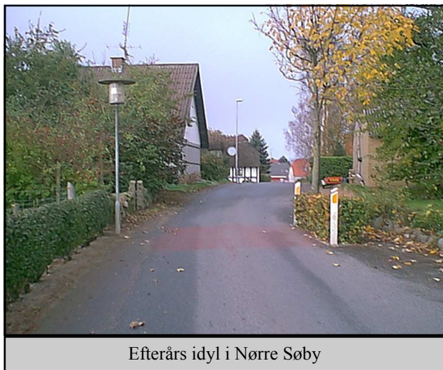
Efterårs idyl i Nørre Søby

Umiddelbart er det ikke det, man forbinder med "det de gemmer på Lokalarkivet". Og dog - ved nærmere eftertanke er det netop det, for "kærlighed" skal ikke alene forstås i traditionel, familiemæssig forstand.