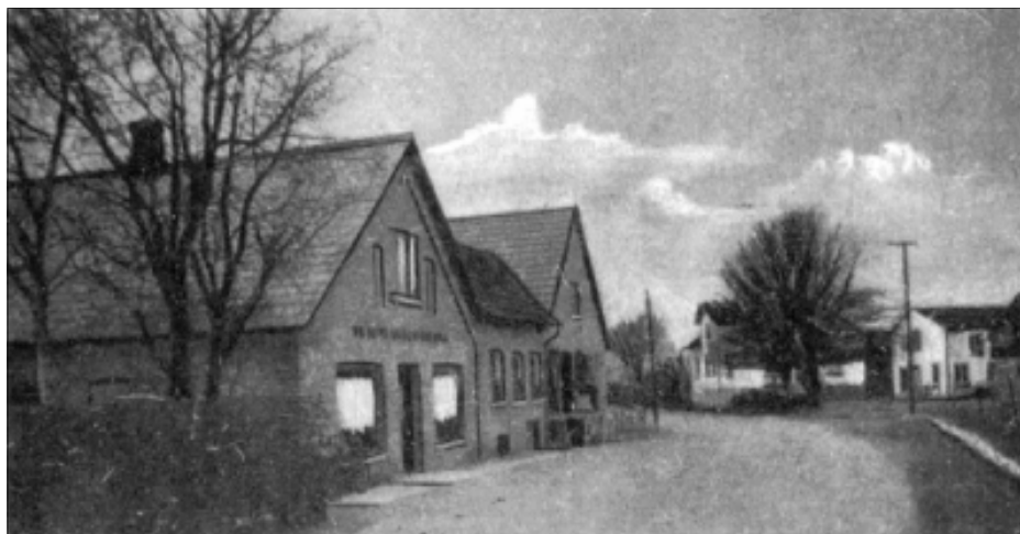
Postkort fra ca. 1950. Vindfanget er nu fjernet og der er sat et nyt skilt op over indgangen.

En gang ugentlig hentede brugsmanden eller en kommis ordre ude hos folk, og et par dage efter blev varerne