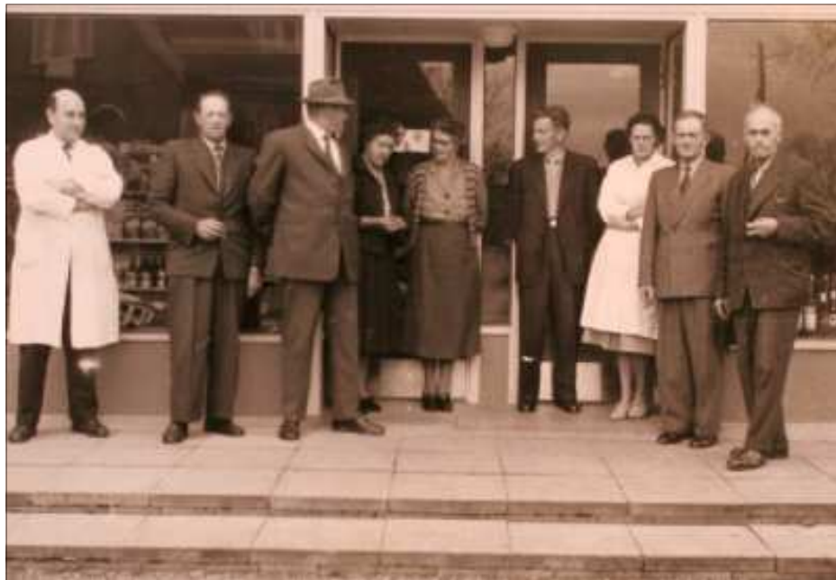
Bestyrelsen 1961 samlet foran den nye butik