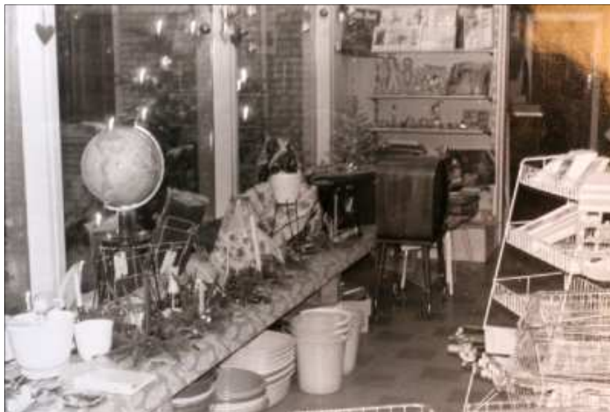
Juleudstilling 1961 i den nye butik

Nørre Søby, du vor kære gamle by, Hvor du ligger smukt og dejligt under sky. Sådan som du er, vi holder mest af dig, Hvor i verden føres end vor vej.