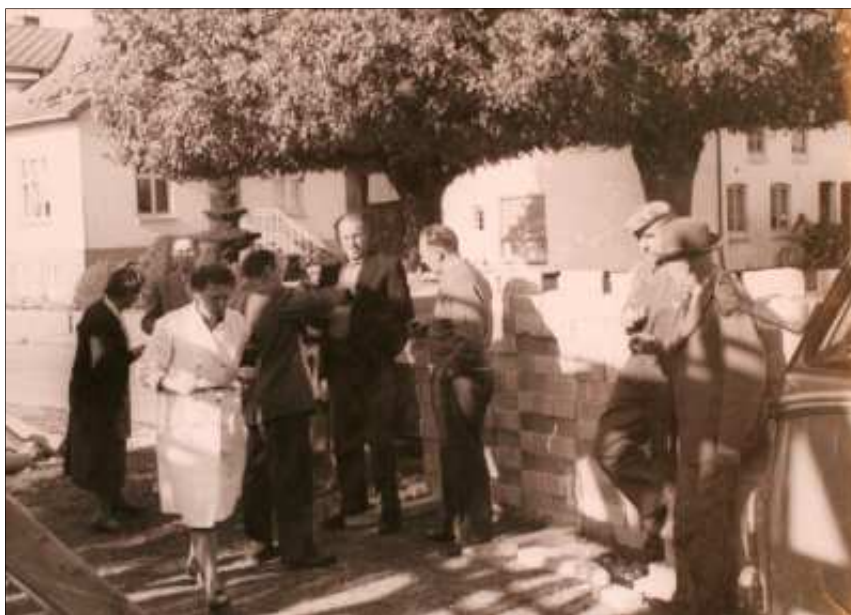
Fra byggeriet af det nye butikslokale i 1960.

blive så billigt som muligt, var det også alles mening, at det fordelagtig- ste måtte være at bygge til mejeriet ud imod Landevejen, hvilken tilbyg-