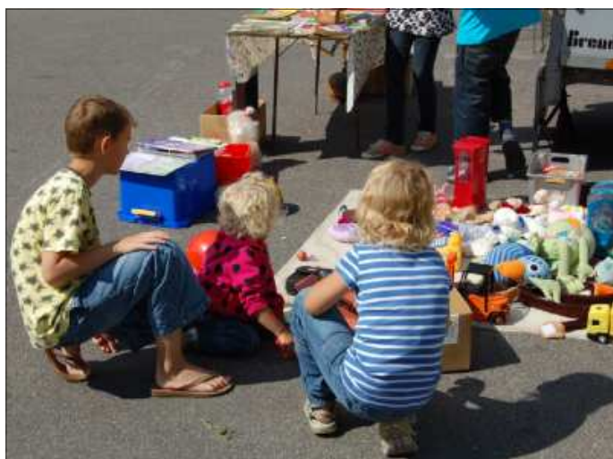
Markedsdag 2008

Man kunne få for 10 øre gær, som blev skåret med en klinge; det lignede nærmest en osteklokke, hvor den store pakke gær var i. Mel, gryn, sukker og salt var i store skuffer bag disken, og poser hang ved siden, så det blev ve-