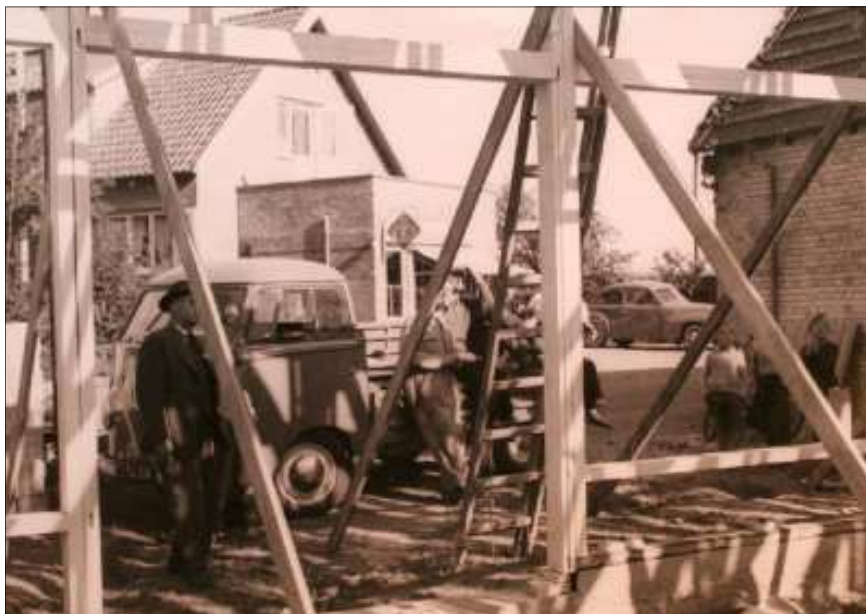
Byggeriet i 1960. I baggrunden ses Nørre Søby Bageri, der for længst er lukket.

Allerede 8. marts 1892 holdtes stiftende generalforsamling; udvalget var klar med forslag til vedtægter, som blev vedtaget. Det gjorde den foreslåede udvidelse af mejeriet også ”med 6 Alen ud mod Landevejen, som da indrettes til Udsalgs- og Varelokaler”. – Og en vigtig del: aktietegning, 48 medlemmer tegnede aktier for 770 kr. – en bestyrelse udnævntes; den blev det før nævnte udvalg. –