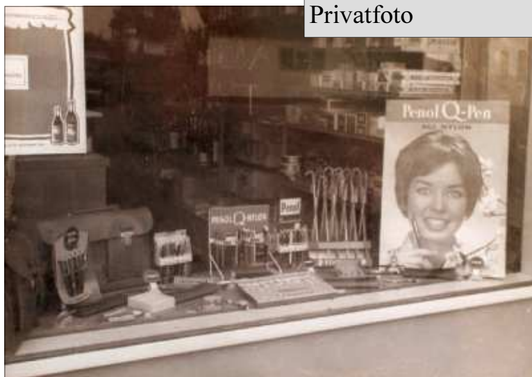
Brugsforeningens udstillingsvindue i den nye butik 1961