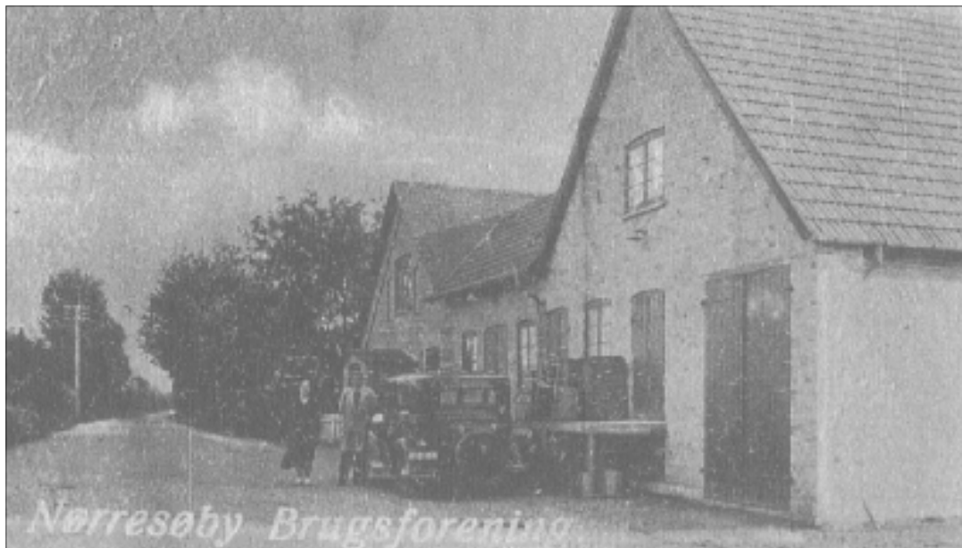
Postkort stemplet 2. september kl. 20.00 1942 i Roskilde.

haverne i her- værende mejeri et møde angå- ende oprettel- sen af en for- brugsforening. Mødet var godt besøgt, og de tilstedeværen- de var alle stemt for op- rettelsen af en sådan forening, og for at an- lægget kunne