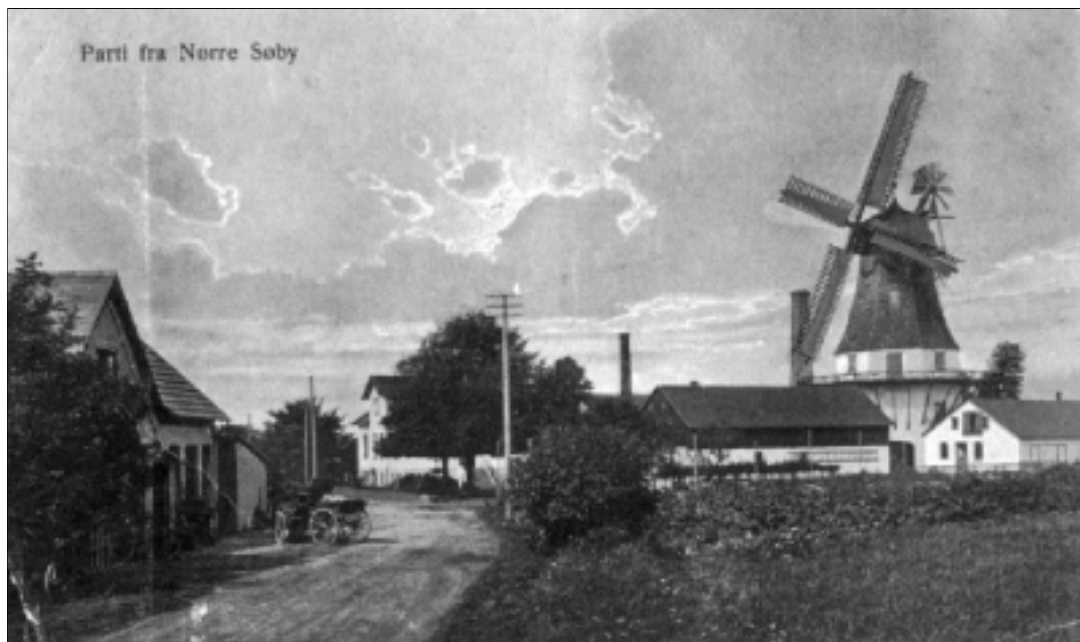
Nørre Søby Brugsforening og Nørre Søby Mølle ca. 1928.

dag danner basis for opfyldelsen af de drømme, forældrene havde ved fødslen – godt og vel endda. Fødselsdagsbarnet kan se tilbage på 100 - travle år, i en tid fuld af store begivenheder hjemme og ude, med udvikling og fremskridt som aldrig før. Dagen vil sikkert blive markeret efter fortjeneste.