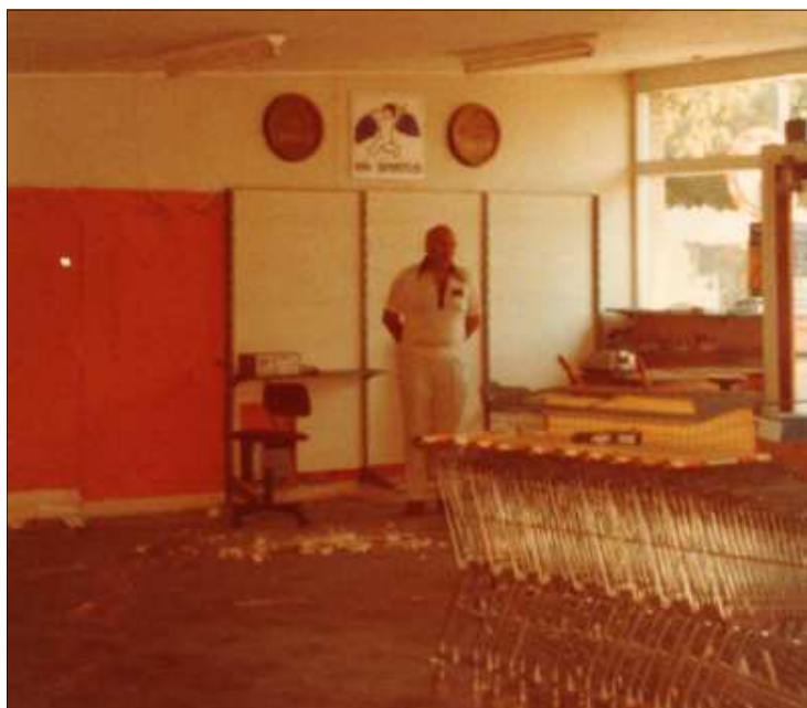
Indkøbsvognens indtog i Nørre Søby

mandag den 1. november 2010 kl. 14.30, i Arkivet på Røjlevej 22. Aase Reffstrup