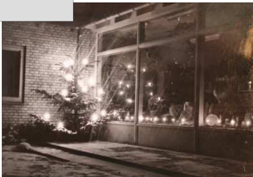
Julestemning ved Brugsforeningen Privatfoto 1961