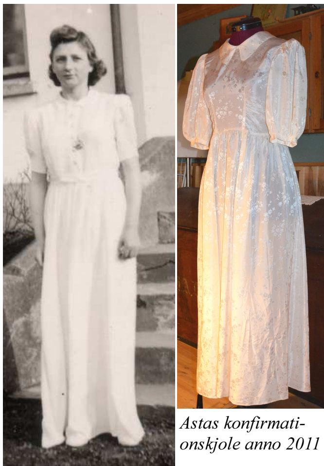
Astas konfirmationskjole anno 2011

Den for de unge så skønne og løfterige konfirmationstid er for længst overstået, og ottendeklasserne rundt om i landet er netop startet op med forårets hovedpersoner på skolebænkene.