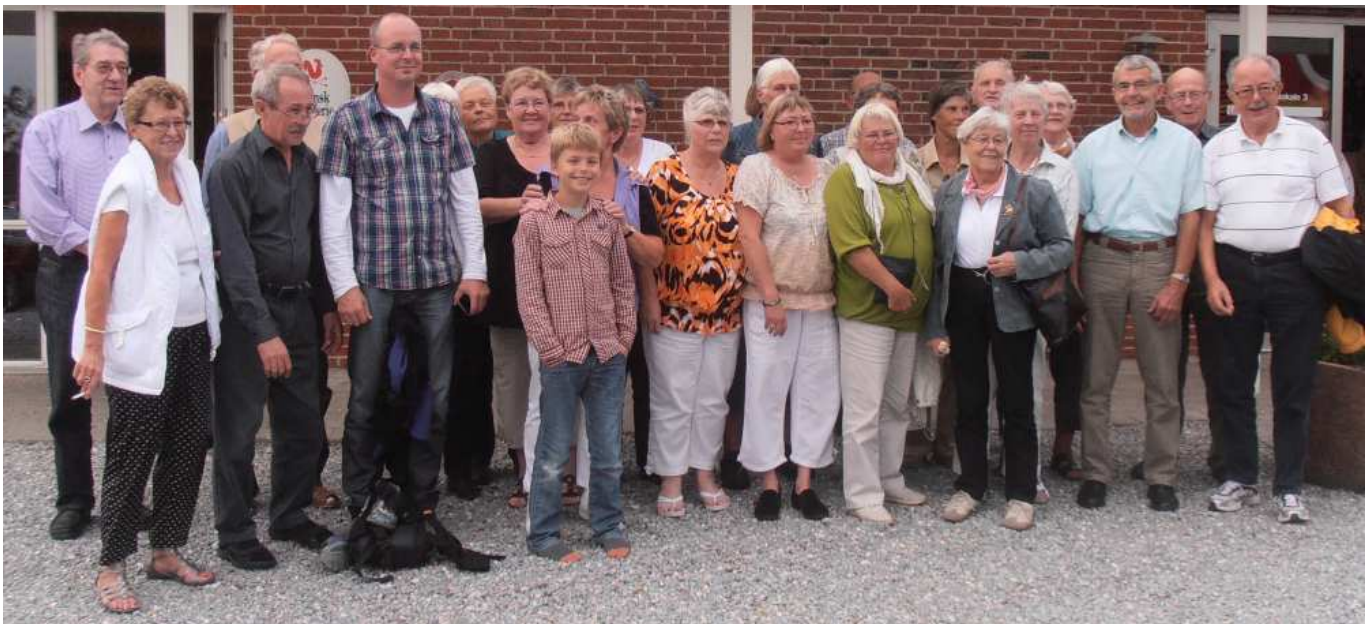
Nørre Søby Koret på sommertur 2011

get som helst om koret på forhånd tog jeg med Kai til en øveaften. Det blev en dejlig aften og jeg var ikke det mindste i tvivl om at der ville kunne blive godt match mellem Nr. Søby Koret og mig, forudsat at koret selvfølgelig havde det lige sådan. 1. september 2002 begyndte jeg som dirigent for Nr. Søby Koret. Jeg hav-