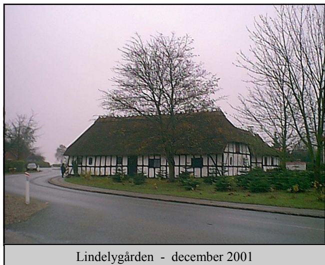
Lindelygården - december 2001