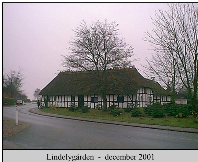
Lindelygården - december 2001