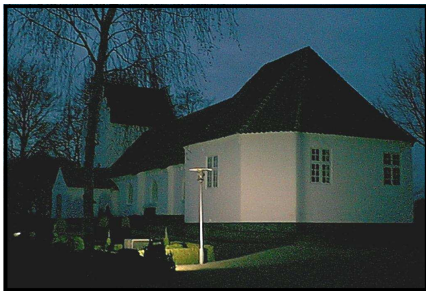
Nørre Søby Kirke - på årets korteste dag

for en selv. Hun kom i skolenævnet, Skolen var lille; hun tænkte på gæssene: luft under vingerne, flyv højt - hun var begyndt at spinde sin røde tråd. Men det blev ikke altid lige let at spinde den røde tråd, for det der netop, også for hende, var trygheden i hverdagen, landsbyens kendte rytme blev tit en hæmsko, når beslutningerne skulle tages - sårbarheden var stor på begge sider.