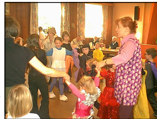
Sanglege ved årets fastelavnsfest

”Da Capo Koret” på genvisit i Nr. Sø- by. Sammen gav vi koncert i Nr. Søby