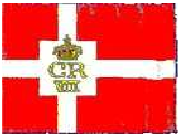
Stutflag med Christian VII's monogram

dette påbud. Forholdene i Middelhavet omkring 1750 med mængder af sørøverier mm. fra bl.a. de nordafrikanske stater gjorde, at der 25. marts 1757 blev udstedt en ny Kgl. Forordning. Forordningen bestemte, at danske kofardiskibe, der sejlede til Gibraltarstrædet og Middelhavet, skulle vise Stutflaget med det kongelige ciffer i midten af flaget.